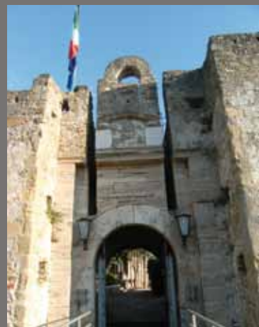
Porta d'ingresso al Castello Angioino - Aragonese

Il borgo storico di Agropoli, a strapiombo sul mare, conserva intatta la fisionomia medievale, con il fitto intreccio di case, le caratteristiche stradine e i piccoli slarghi. Vi si accede attraverso la seicentesca porta d'ingresso, simbolo della Città, posta al termine dei famosi "scaloni" che si affacciano sullo splendido porto turistico.