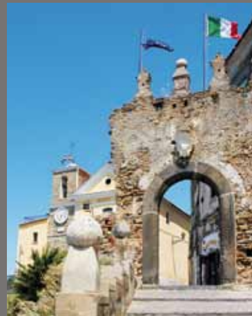
Porta d'ingresso al Borgo antico