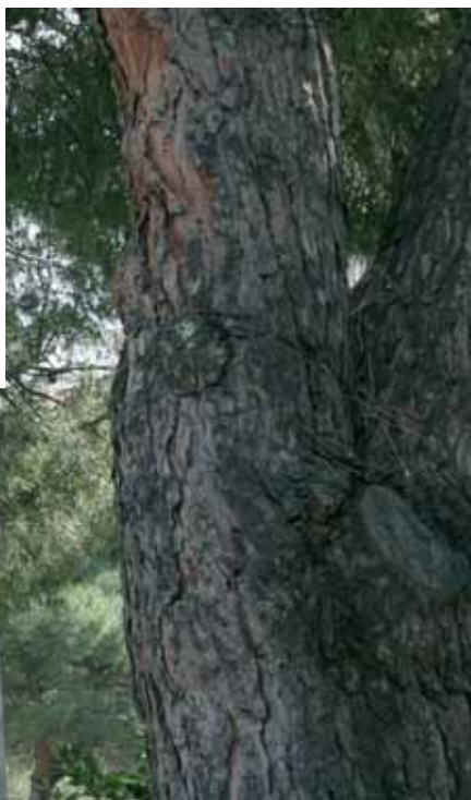
11. Via Marco Polo