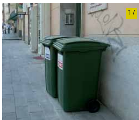
17. Contenitori per la raccolta differenziata

Partita la mappatura che individuerà con precisione le aree disponibili e concedibili