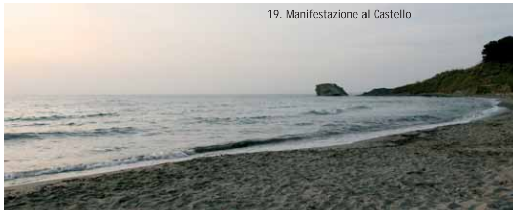
19. Manifestazione al Castello

Aperta a docenti, genitori e rappresentanti della Asl, vigila sulla qualità della refezione scolastica