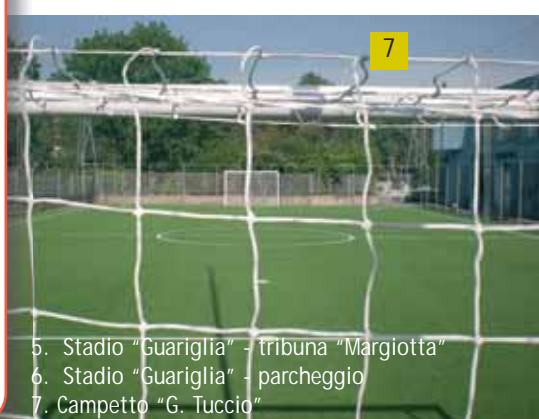
5. Stadio "Guariglia" - tribuna "Margiotta" 6. Stadio "Guariglia" - parcheggio 7. Campetto "G. Tuccio"