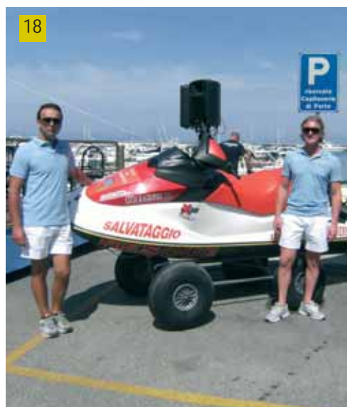
18. Acquabike da salvataggio